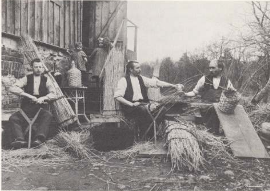
Utanför korgmakareverkstaden i gamla möllan vid sekelskiftet.

glasflaskor och som sedan användes för försändning av ättika. Korgarna gjorde att flaskorna inte blev så ömtåliga för stötar.